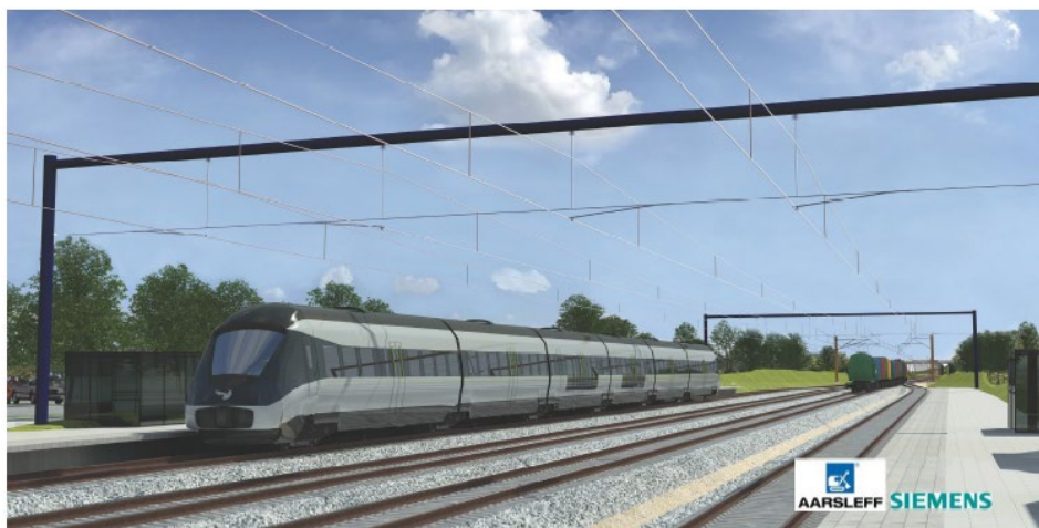
Figur 3: Visualisering af portalmaster ved dobbeltspor