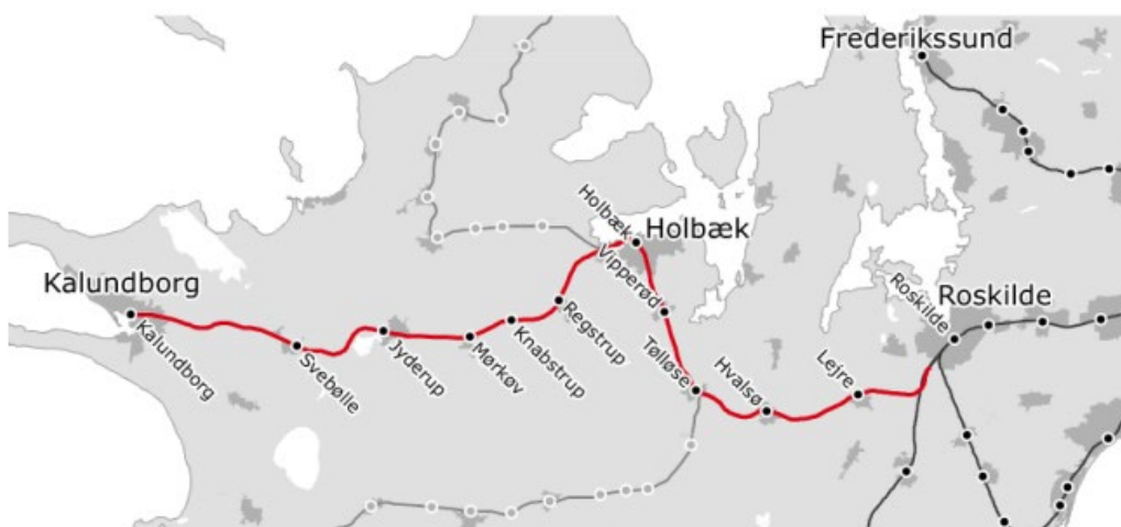
Figur 1: Roskilde - Kalundborg banestrækningen.

fremtidens jernbane med en fleksibel og effektiv jernbanedrift for person- og godstransport. Dette bidrager til en pålidelig og attraktiv jernbane til gavn for passagerer, operatører og miljøet. Gevinsten ved at elektrificere mellem Holbæk og Kalundborg er desuden, at man kan køre med den samme type togmateriel på hele Sjælland, og at passagerer på visse afgangseksempelvis kan køre fra Kalundborg til Helsingør uden at skulle skifte tog. Det giver et løft til togbetjeningen, som med dagens trafik vil komme ca. fire millioner rejsende til gode om året.