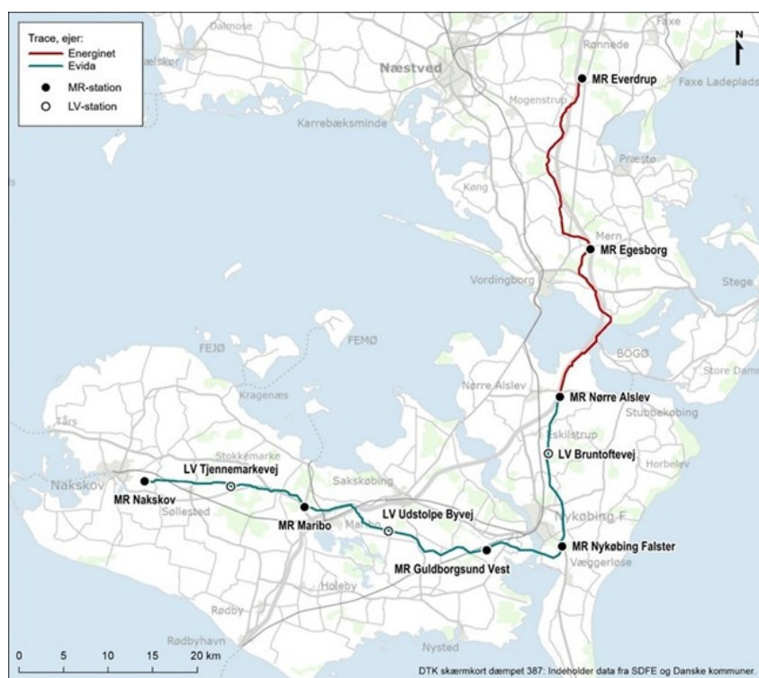
Figur 1 viser oversigt over linjeføringen for gasrørledningen Grøn Gas Lolland-Falster

Projektet Grøn Gas Lolland-Falster anlægges på en ca. 115 km lang strækning mellem Everdrup på Sjælland og Nakskov på Lolland. Undervejs krydser gasrørledningen Storstrømmen via Farø til Falster. Ved Nykøbing Falster krydses Guldborgsund. Undervejs anlægges syv måler- og regulatorstationer (MR-stationer) og tre selvstændige linjeventilstationer (LV-stationer).